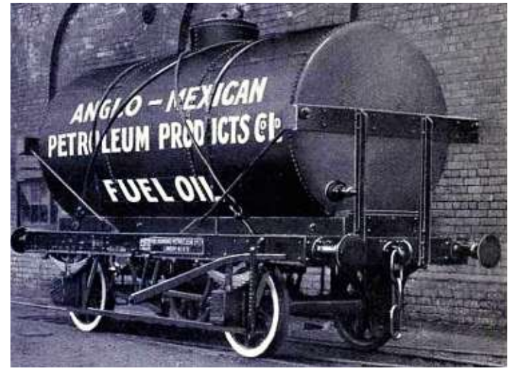
Después de una etapa histórica de participación de empresas privadas en la extracción petrolera, hoy se inicia una nueva era.