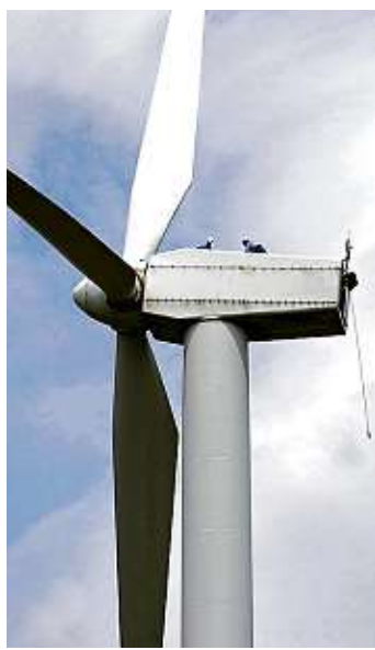
Generará Vientos del Altiplano 280 gigawatts-hora al año.

Como van las cosas, puede ser que la aprobación de dicha