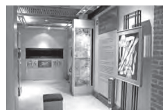
► La obra.