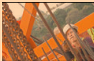
Transparencia. Pretende frenar los “sindicatos de membrete”.