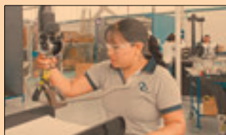
El 388 bis permitiría que los trabajadores elijan su sindicato.