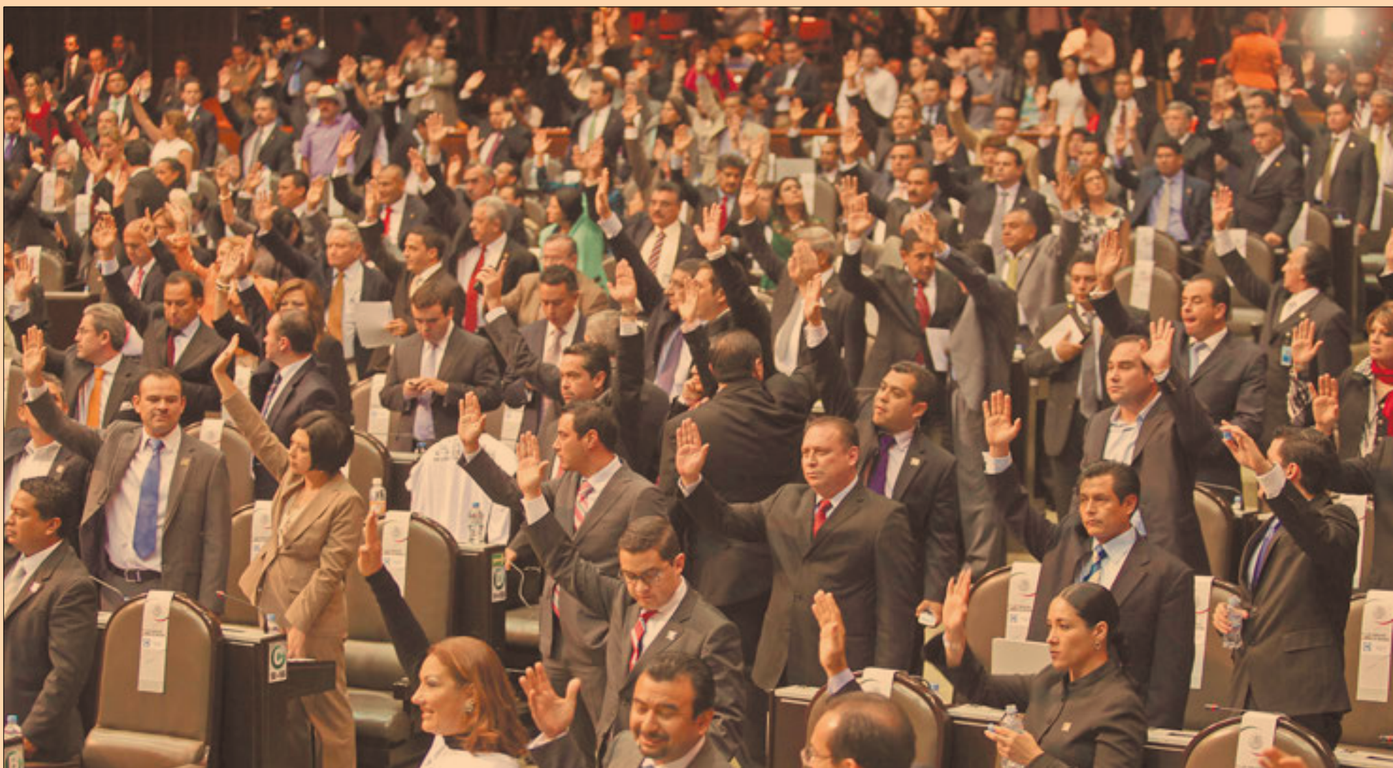
La Cámara Baja en San Lázaro continúa analizando la reforma laboral en lo particular.