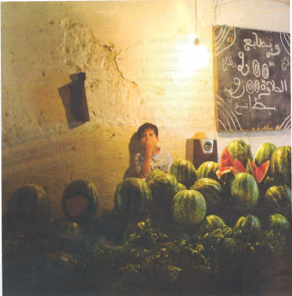
► El alza de precios de los productos básicos en Marruecos generó movimientos de resistencia civil conocidos

Este año, la crisis global se expresó en Argelia, donde las protestas se originaron por el alza en los precios de alimentos, particularmente en las ciudades de Cabilia, Bejaia y Tizi Ouzou. Al concluir los primeros 10 días de enero, habían muerto dos personas y 400 resultaron heridas durante los disturbios, según cifras oficiales. En respuesta, el