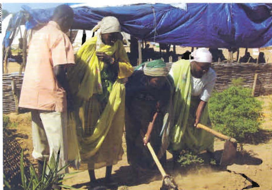
▶ Los sudaneses (en la foto) y los somalíes reciben el 60 por ciento de la asistencia alimentaria mundial

El comunicado de la FAO, la Organización Mundial de la Salud, el Programa de las Naciones Unidas para el Desarrollo (PNUD), el Fondo de Naciones Unidas para la Infancia y el Alto Comisionado de Naciones Unidas para los Refugiados señalaba que la crisis alimentaria en América Latina ponía en riesgo los logros alcanzados para reducir la pobreza durante esa década. Esta situación obedecía a la “inflación de los pobres”, que se estima 3 por ciento arriba de la inflación general y afecta a las familias que destinan más de la mitad de su ingreso para adquirir alimentos , “y ahora a mayor precio”.