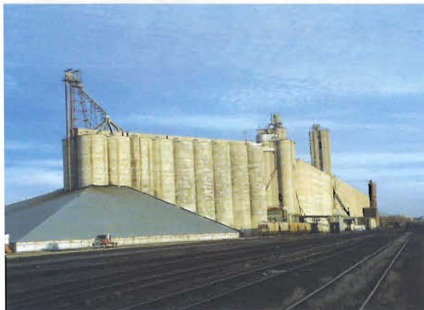
▶ Agroindustrias, como Cargill, consideran a los países pobres mercados cautivos de los excedentes

Esa situación de dependencia alimentaria “es lastimosa” porque México tiene un gran potencial en recursos humanos. Desafortunadamente se condena al desempleo a millones de personas en el campo porque en éste no se ha invertido. Por esa razón, México es el país con mayor índice de vulnerabilidad alimentaria en toda América Latina; sus