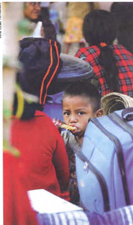
► La población de los países pobres es la principal afectada por la crisis alimentaria

Viven en condiciones de pobreza extrema similares a las que se registran en